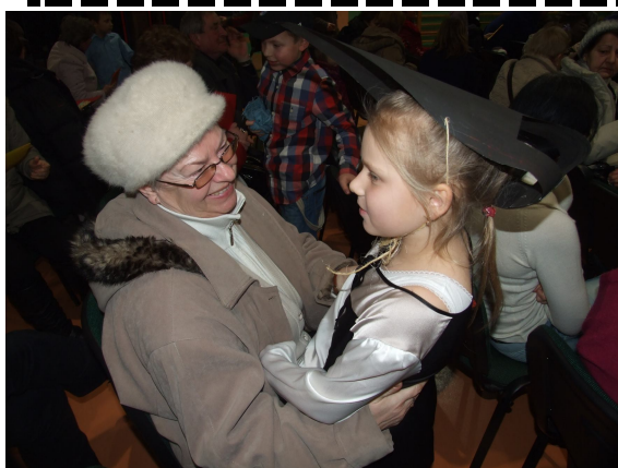
Dzień Babci i Dziadka