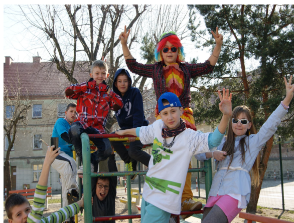
Pierwszy Dzień Wiosny