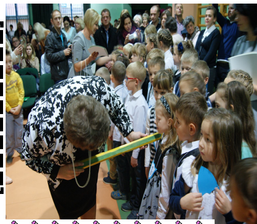
Pasowanie na ucznia

Każdy wie, że rok szkolny jest obfity w treści nauczania, które muszą opanować dzieci. W naszej szkole dbamy również o rozwój emocjonalno – społeczny uczniów i wspólnie organizujemy uroczystości i imprezy, które na stałe wpisały się już w Kalendarium Roku Szkolnego.